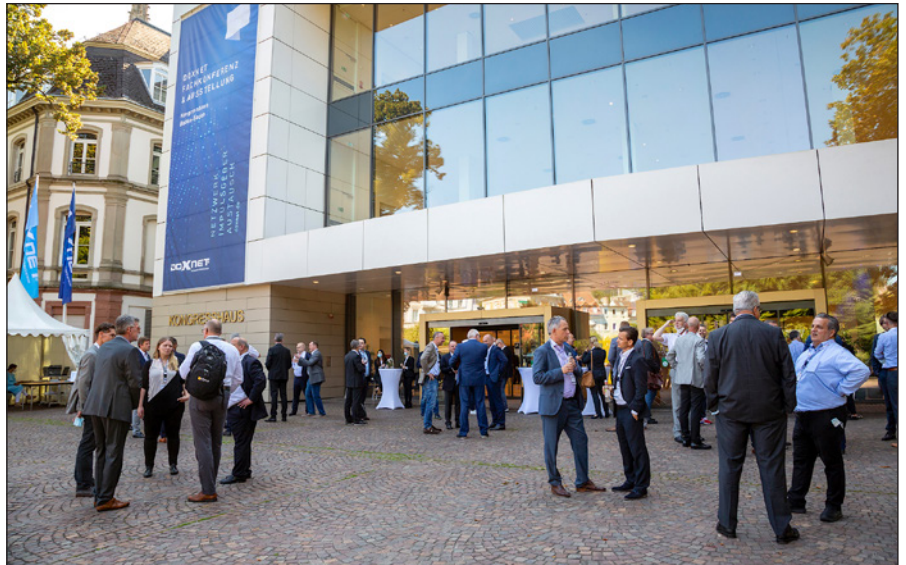
Endlich wieder gezielter Wissens-Austausch und gepflegtes Netzwerken: Das DOXNET-Jahresprogramm 2022 wartet wieder mit gebündeltem Fachwissen auf.

Der DOXNET-Vorstand setzt dabei auf einen multimedialen Weg: Neben der Präsenz auf verschiedenen sozialen Kanälen gibt neuerdings der DOXNET-Imagefilm spannende Einblicke in die Aktivitäten des Verbands. In dem Clip kommen verschiedene Mitglieder zu Wort, die in kurzen Statements den Verband vorstellen, die Vorzüge („Ungezwungener Rahmen“, „freundschaftlicher Umgang“, „gegenseitig von den Erfahrungen anderer profitieren“) und die Benefits („Ideenaustausch“, „Wissenstransfer“, „Trends erkennen“) von DOXNET auf den Punkt bringen. Außerdem gibt der Film einen Überblick über die verschiedenen Angebote und Veranstaltungen des Verbands. Der Clip ist abrufbar