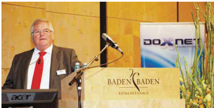
Doxnet | 12

Auch in diesem Jahr haben die Organisatoren der mittlerweile 19. Jahreskonferenz die aktuellen Trends nicht verschlafen. Es stehen allein sieben Grundsatzvorträge auf der Agenda. „BigData – Data Science Analytics in der Printingindustry“ (Océ Printing Systems), „Customer Journey und Omnichannel – neue Geschäftschancen mit Echtzeit-Kommunikation“ (GMC Software Technology), „Kommunikation im digitalen Zeitalter – kann jeder machen was er will?“ (Deutsches Institut für Vertrauen und Sicherheit im Internet DIVSI), „Einsatz der Spektralwert-Analyse im Highspeed-Inkjet