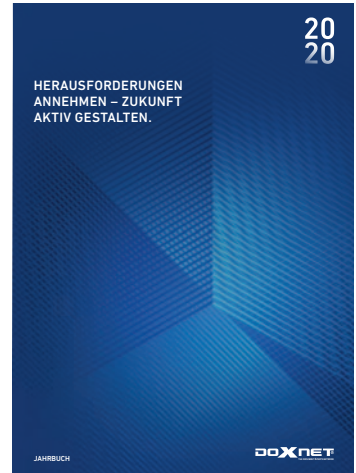
Das Doxnet-Jahrbuch 2020.

Der Fachverband bedankt sich herzlich bei allen seinen Mitgliedern für die tatkräftige Unterstützung, speziell natürlich bei den Anzeigenbuchern. Der Versand des Jahrbuchs an rund 1.500 Dokumentenprofis, davon 720 Exemplare an Mitglieder und 63 Exemplare an die